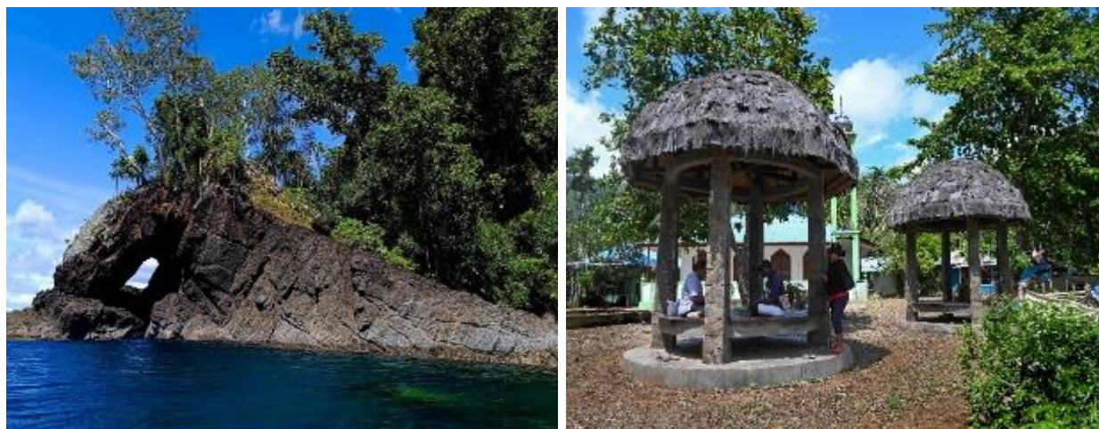
Gambar 1. Potensi kelayakan objek daya tarik wisata air terjun

Sampai saat ini pemerintahan distrik maupun Kabupaten Sorong belum memberikan perhatian serius untuk pengembangan lokasi air terjun sebagai obyek wisata, kecuali beberapa Lembaga Swadaya Masyarakat (LSM) seperti karang taruna dan organisasi kemasyarakatan lainnya dalam bentuk seminar dan pelatihan singkat. Dari hasil wawancara dengan dinas pariwisata provinsi menyebutkan bahwa saat ini pemerintah provinsi sedang dan sudah programkan untuk mengembangkan air terjun di Kampung Asbaken sebagai tempat wisata namun belum menjelaskan secara rinci jenis program seperti apa yang mau dikembangkan disana.