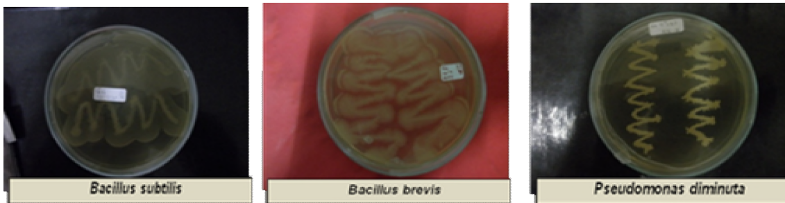
Gambar 1. Performan bakteri yang diisolasi

Gigaspora margarita . Dijumpai enam bakteri dengan genus Bacillus dan 1 bakteri genus Pseudomonas .